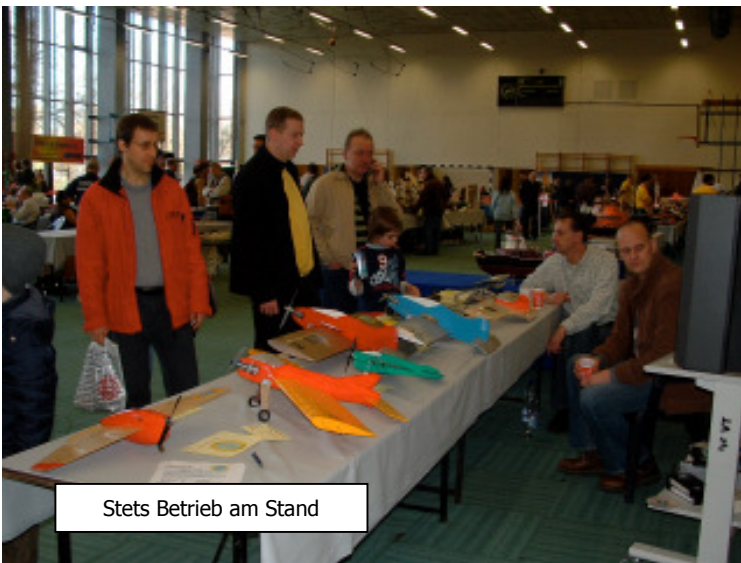
Stets Betrieb am Stand