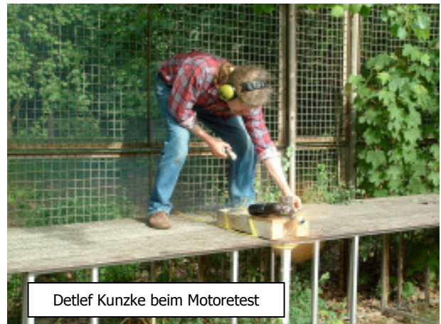
Detlef Kunzke beim Motoretest