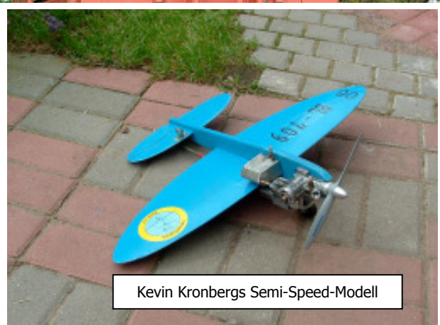
Kevin Kronbergs Semi-Speed-Modell

In Vorbereitung auf den Wettkampf in Sebnitz stand in der Folge auch ein Reservemodell bereit. Auch der Einstieg in die neue