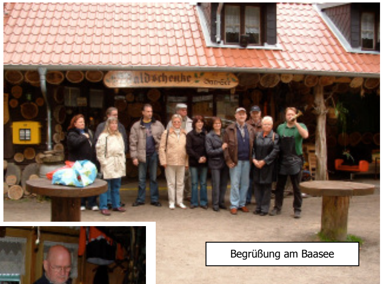
Begrüßung am Baasee

Am 25. April trafen sich alle nach gut 50 km Autofahrt am Stadtrand von Bad Freienwalde. Pünktlich um 17.00 Uhr wurden wir vom Baasee-Wirt mit Waldhornsignal begrüßt. Mit viel Spaß wurde dann der rustikale Innenraum der Gaststätte in Besitz genommen. Hier war schon ein wirklich reichhaltiges Buffet rund um den Wä-