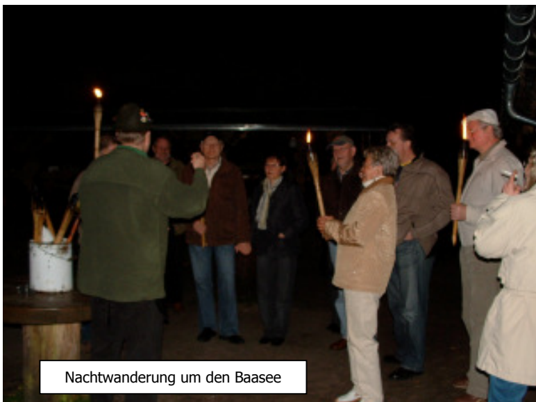
Nachtwanderung um den Baasee

Den Abschluss dieses gelungenen Clubabends bildete dann eine kurze Nachtwanderung mit Fackeln um den See. An den interessanten Stellen wurde bei einem kurzen Halt Wissenswertes vermittelt. Es war schon neuer Tag, als dann die Rückfahrt angetreten wurde. Insgesamt ein